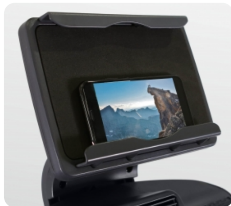
Съемный держатель для мобильных устройств