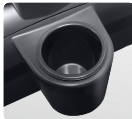
Подставка под бутылку