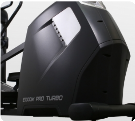
Маховик с инерционным весом 25 кг