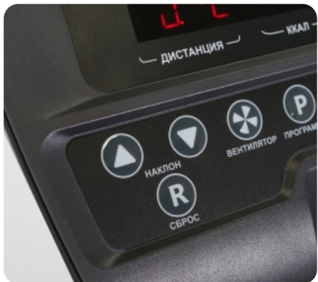
Русифицированные кнопки консоли