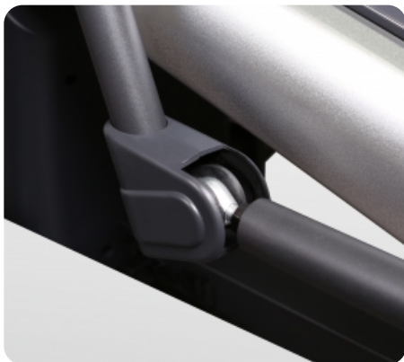
Кинематические полностью подшипниковые сочленения