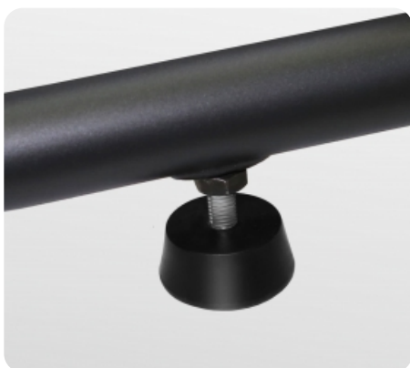
Компенсаторы неровностей пола