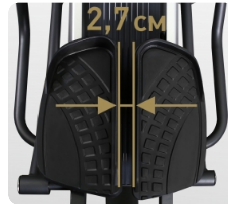
Расстояние между педалями (супермалый Q-Фактор) 2,7 см