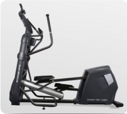
Крупногабаритный эксклюзивный дизайн