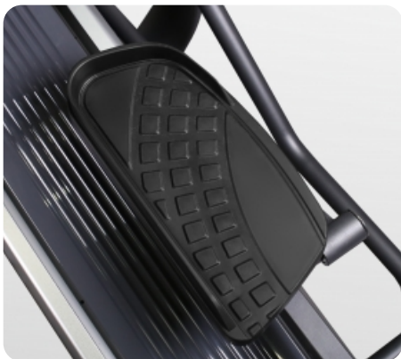
Антискользящие педали увеличенного размера