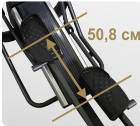
Длина шага 50,8 см