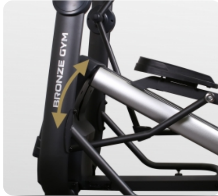
Электрически изменяемый угол наклона (15 уровней)