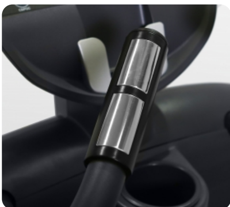
Сенсорные датчики пульса