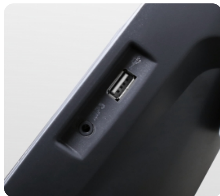
USB-выход для подзарядки мобильных устройств